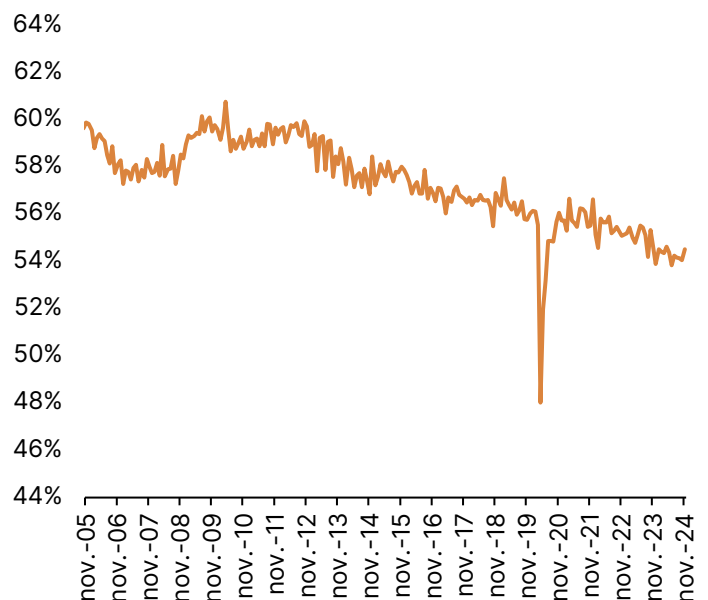
Fig. 3. Tasa de informalidad laboral