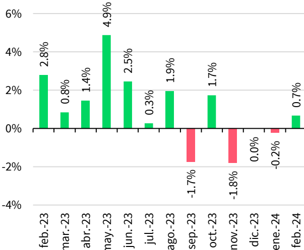
Fig. 2. Crecimiento mensual de la IFB