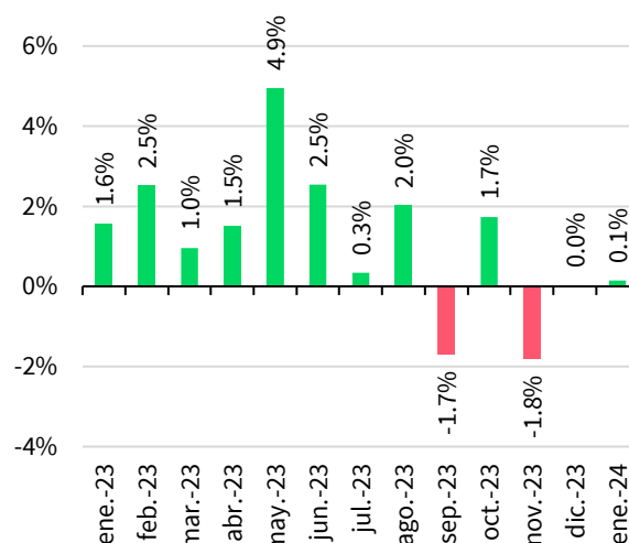
Fig. 2. Crecimiento mensual de la IFB