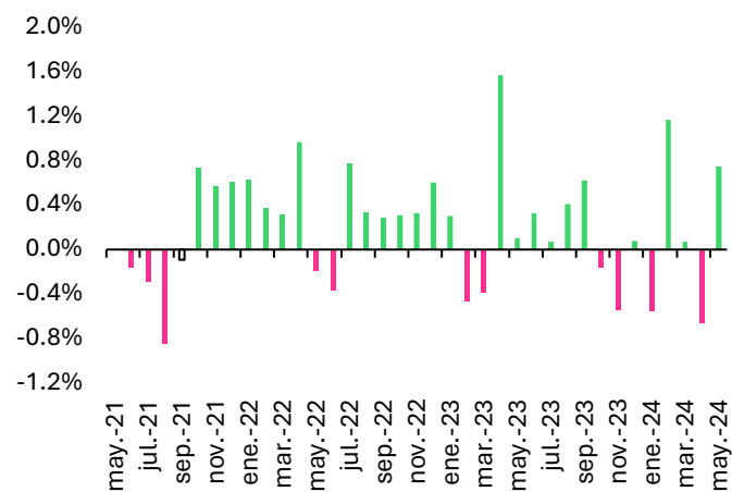
Fig. 2. IGAE, var. % mensual según cifras desestacionalizadas