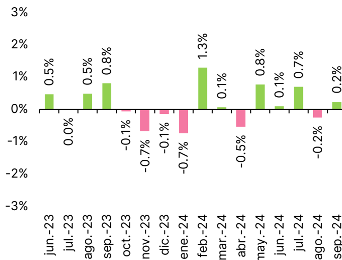
Fig. 2. IGAE, var. % mensual según cifras desestacionalizadas