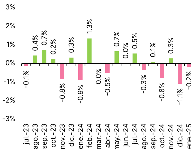
Fig. 2. IGAE, var. % mensual según cifras desestacionalizadas