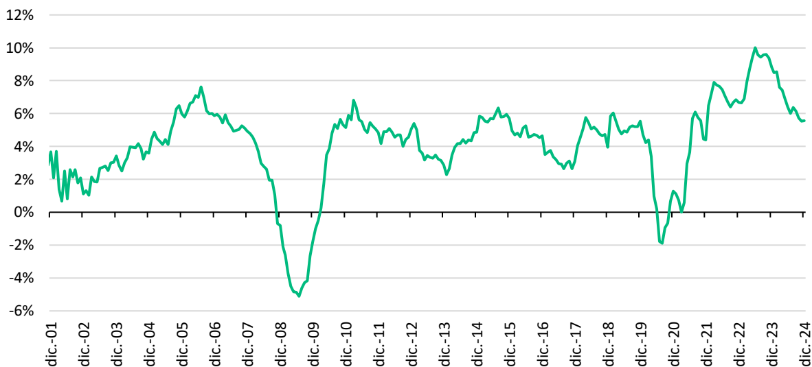
Fig. 3. Masa salarial real según cifras del IMSS, var. % anual